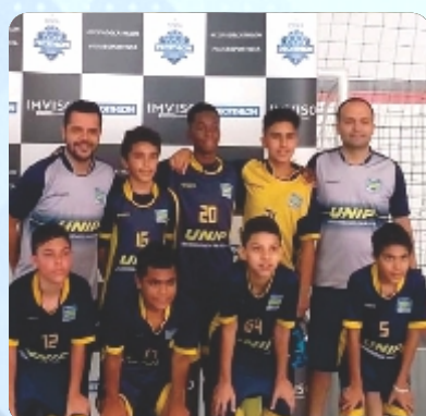
Nossos atletas participam dos maiores eventos esportivos.