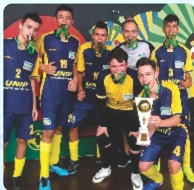
Equipe SUB 17 em disputa da Copa Kairós