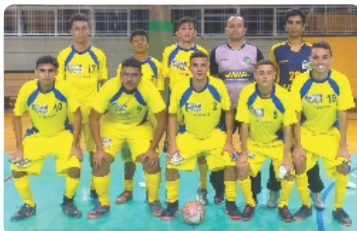
Jogo da Copa Play FC na prevenção do câncer de mama.