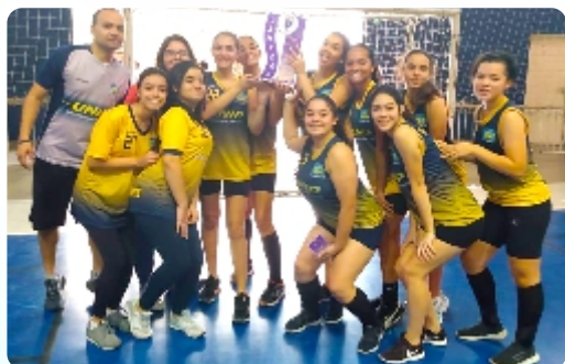
Equipe de Handebol ganha o Festival da Amizade.